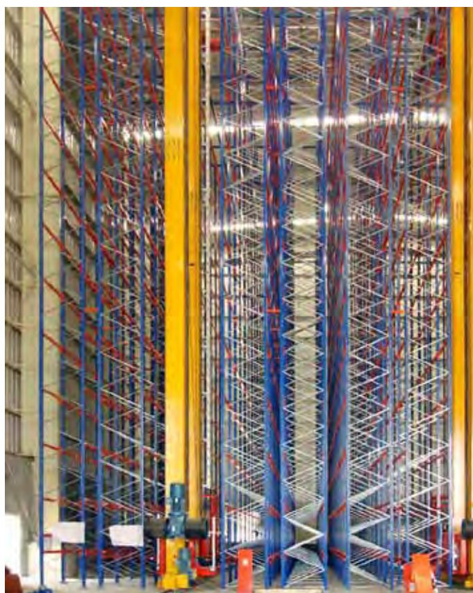
Склад с высотными стеллажами и устройством для обслуживания стеллажей