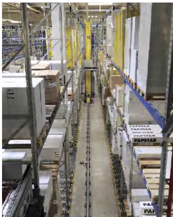
Papstar, складирование паллет. На самом нижнем уровне паллеты загружаются в гравитационные каналы для их последующей подачи в зону коммисионирования.