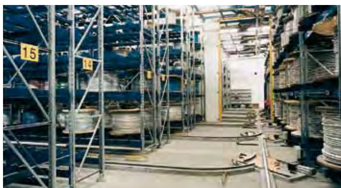
Устройства для обслуживания стеллажей, способные перемещаться по кривой