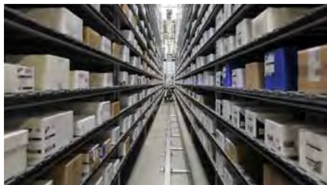
Papstar, складирование груза на сплошных полках

Автоматизированные паллетные стеллажи являются, как правило, полностью автоматизированными системами, которые, прежде всего, служат в качестве склада для буферного или резервного хранения товара. Особенностью данной системы являются центральные пункты сдачи-приема товара, расположенные на торцевых сторонах стеллажа. Отсюда осуществляется снабжение, например, производственных установок, систем для коммисионирования товара или транспортно-экспедиционных отделов целыми паллетами товара.